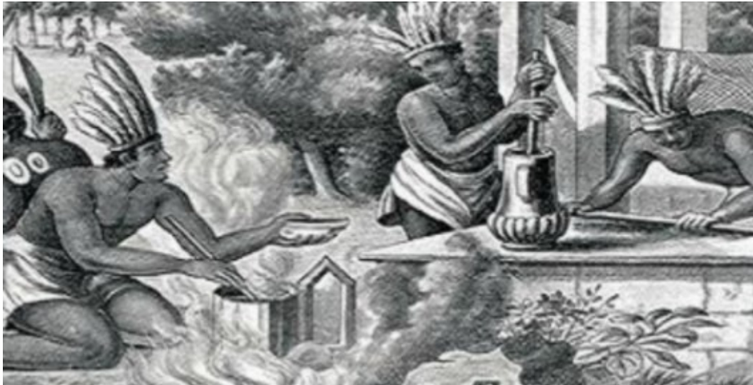
AZTECAE COCOAM PRAEPARANTES

NOVI TRACTATÛS DE POTU CAPHE, DE CHINENSIVM THE, ET DE CHOCOLATA. Auctores : Philippe Sylvestre Dufour, Antonio Colmenero de Ledesma, Jean-Jacques Manget. Genevae 1699.