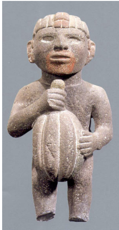
AZTECUS FRUCTUM CACAONIS TENENS

aegrotis. Quod ad Cacao selectionem nonnihil virides adhuc colligendi, & tamen sicciore & vetustiores pro compositione seligunt, nihilominus sapore aspero, astringente & ita ingrato donatos ut multi qui fructum degustârunt ab hoc potu abhorreant. Qui illo utuntur refrigerans esse aiunt, nec unquam, teste experientiâ, inebriare. En ergo Cacao qualitates ubi quis impermixtis utitur, desiccantes nempe & astringentes, ac proinde terrestres ac refrigerantes, ut sunt omnia styptica, quibus aspera & acida accensentur.