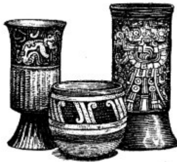
ECCE MEXICANA VASA CACAOTICA quae inveniuntur in Museo Britannico.

Quidam nunc potum tinctum & coloratum volunt Achiota quae nihil aliud est quam pulvis sive pastillus ex fructu quodam paratus, quem aiunt in colica praestantissimum esse remedium. Sunt enim Americani magni impostores, qui plantis suis magna nomina imponunt, ut famae laudem acquirant. Haec de Chocolata quae in nundinis & foris vulgatissima venditur. Fit enim alias & varii coloris quam Xocoatole & Chillatole